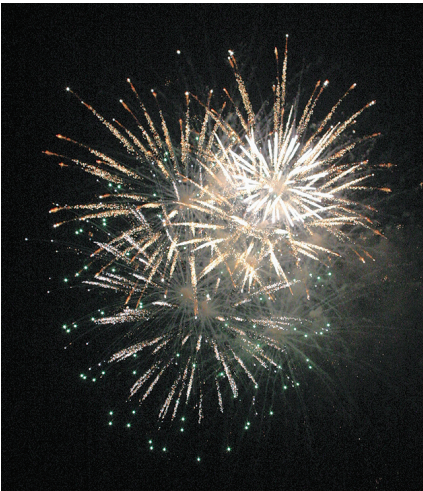
花火大会には毎年7000人が来場