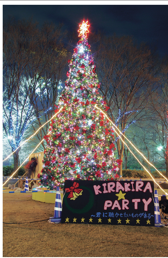
高さ6メートルのクリスマスツリー(=昨年)

ど約230人が参加して、東海大学前駅周辺や地元商店街、大根川などを一斉清掃した。集まったゴミは可燃242袋、不燃23袋、缶4袋など。