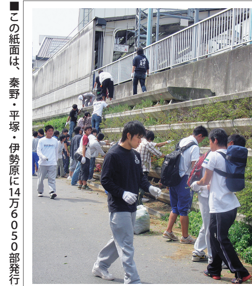
駅周辺を一斉清掃(=10月5日)