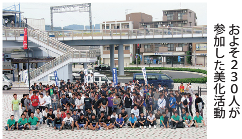
およそ230人が参加した美化活動

組むなど、周辺住民との交流を深めに行っている。湘南学生会は、建学祭やオリエンテーションなどの