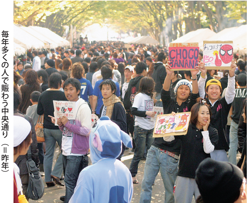
毎年多くの人で賑わう中央通り（11昨年）